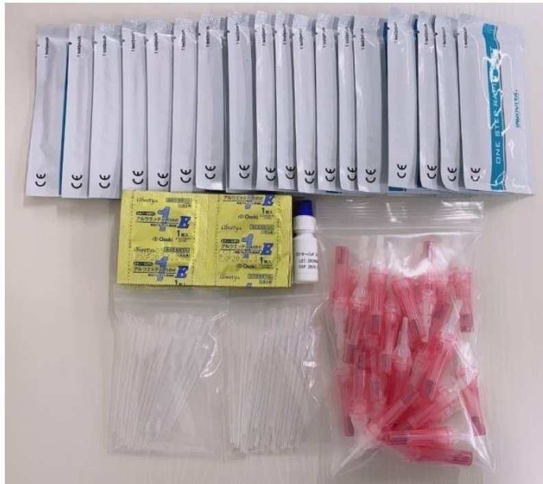
小分け包装無（20セット単位）

本新型コロナウイルス（COVID-19）抗体検査キットは ISO 認証取得企業イノビータ（INNOVITA）（唐山）生物技術有限会社（以下「INNOVITA 社」）が研究発売されております。また、本抗体検査キットは日本厚生労働省に承認されていないため、研究用試薬としての販売となります。